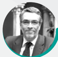
arch. NATALE RAINERI Raineri Officina di Architettura