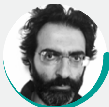
arch. GIANLUCA MEZZANOTTE landBAU S.r.l.